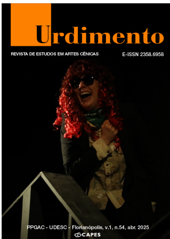
Imagem da Capa Projeto Gráfico: Marcelo Pires de Araújo Espetáculo: Conversas de Coxia