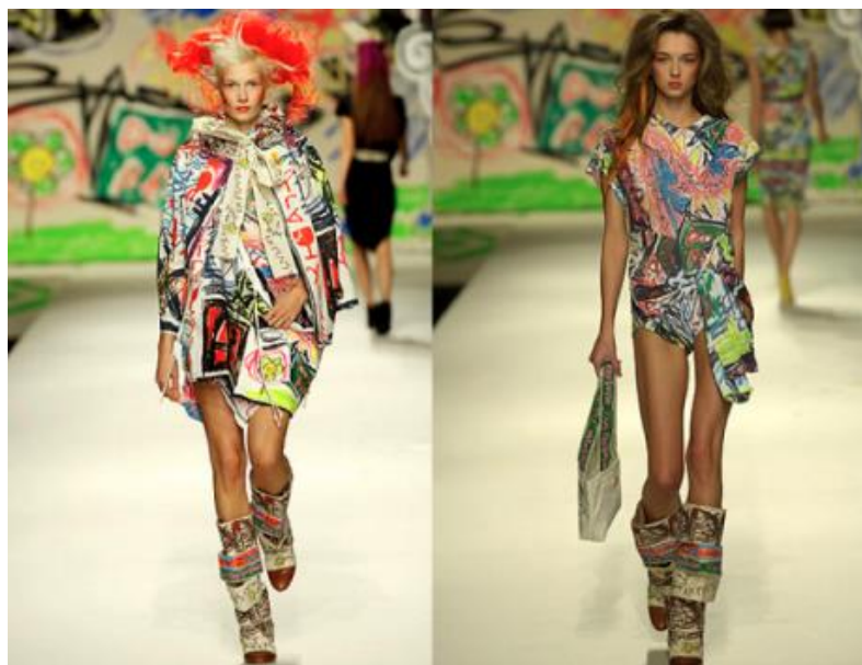
Figura 10. Vivienne Westwood - Primavera de 2007

Outros nomes da moda ousaram incursões similares à arte de rua, como Viviane Westwood, Takashi Murakami, Malcolm Maclaren e Richard Prince (Figura 10).