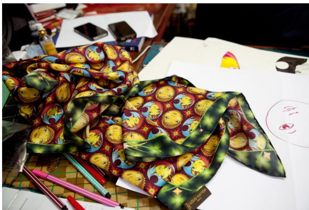
Figura 7. Os Gêmeos para Louis Vuitton

Em 2013, os grafiteiros brasileiros Os Gêmeos criam uma linha de echarpes para a Louis Vuitton (Figura 7), cujo preço de venda em São Paulo era de R$ 1.090,00.