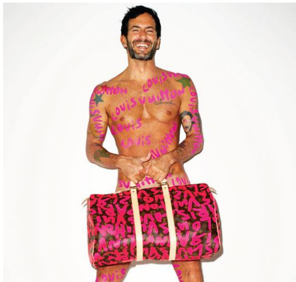
Figura 4. Marc Jacobs e bolsa Louis Vuitton

Na mesma época, a grife retomou o grafite na coleção de Marc Jacobs, através da própria imagem de seu corpo (Figura 4).