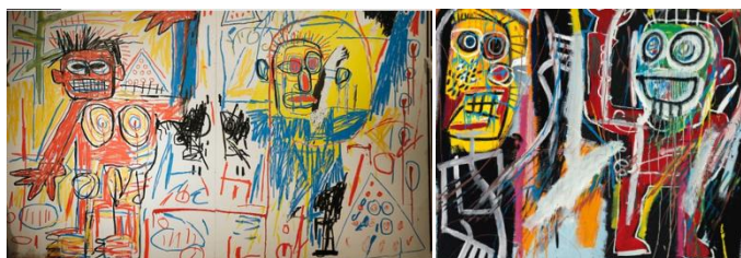
Figura 11. Basquiat

“As obras de Basquiat (Figura 11) estão em primeiro lugar em vendas em Londres, em série de leilões de arte do pós-guerra e contemporânea.” 13