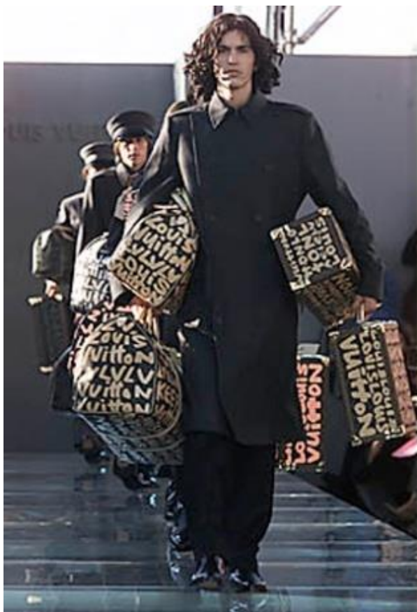
Figura 2. Desfile da Louis Vuitton Primavera 2001 com o monograma da marca desenhado por Sprouse

Como uma homenagem a Sprouse , falecido em 2004, a fachada da Louis Vuitton teve interferência do grafite em 2009 (Figura 3). Em Toronto o grafiteiro foi o Skam .