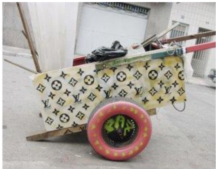
Figura 9. Da série Glamour for All - referência à marca Luis Vuitton – pelo artista OZI