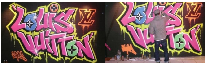
Figura 3. Fachada de lojas

Como uma homenagem a Sprouse , falecido em 2004, a fachada da Louis Vuitton teve interferência do grafite em 2009 (Figura 3). Em Toronto o grafiteiro foi o Skam .