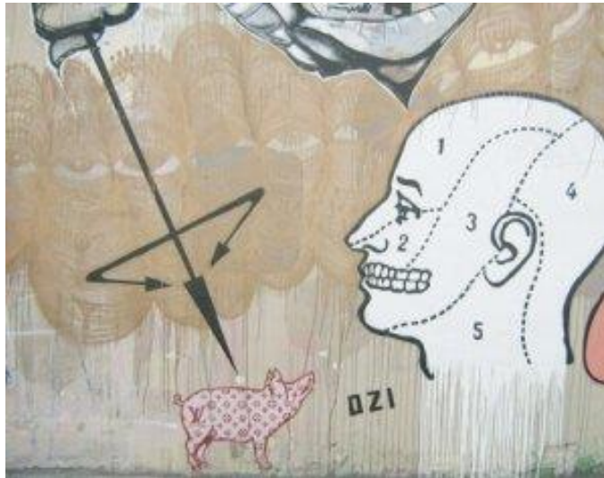
Figura 8. Porco fashion Luis Vitão - referência à marca Luis Vuitton – pelo artista OZI Fonte: Babel das Artes 10

A marca ganha um codinome, assim como os grafiteiros, e Louis Vuitton passa a ser chamado de Luis Vitão (Figuras 8 e 9).