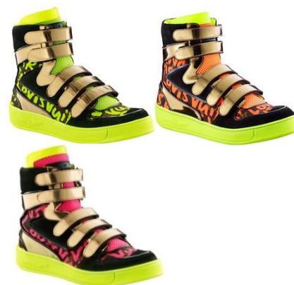
Figura 5. Tênis Louis Vuitton. Fonte: Papelpop 7