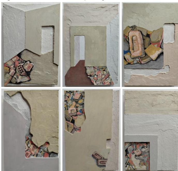
Figura 2: Obras da Série Arqueologias.