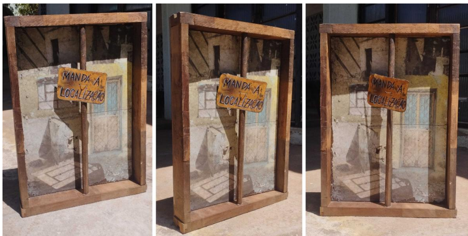
Figura 4: Obra "Manda a Localização" da série Pontos de Referência.