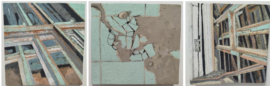
Figura 1: Obras da Série Lapidarium.