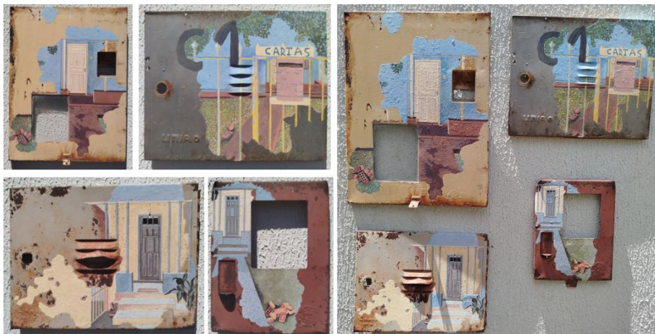
Figura 3: Obras da Série O Lugar do Outro.