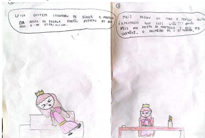
Figura 3 – Páginas 1 e 2 do livro de Leila

Transcrição: LEILA A RARINHA DA FANTASIA