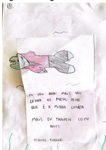
Figura 5 – Página 4 do livro de Leila com resposta do tubarão

Caro tubarão que mora la do fomdo do mar que parece envinito Te convido para uma festa Famtasia Vai ter musica animada” Convidados: proriquando só você mais vai vin mais animais A fantasia mais legal vai cer o ganhador e vários dosinhos para agede comer Espero você! Assinado Leila a rarinha da famtasia.