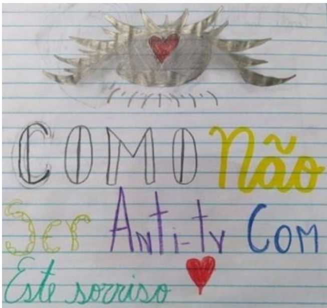
Figura 1: Poema visual de aluna-autora