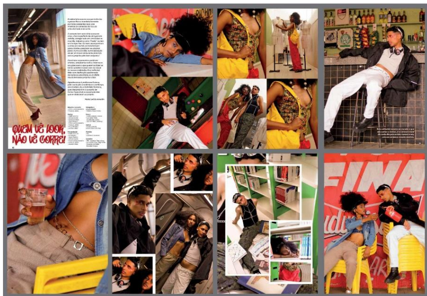
Figura 6: Editorial Quem Vê Look, Não Vê Corre! da segunda edição da Revista Avesso

Como iniciativa de extensão e formação, a Avesso demonstra um caráter profundamente transformador. Ao integrar a teoria do planejamento visual gráfico com a prática da produção editorial – um processo que os estudantes descrevem como muito enriquecedor –, o projeto não apenas desenvolve competências técnicas, mas também estimula a reflexão crítica sobre consumo, diversidade e representatividade, que fazem parte da linha editorial da revista. Para os estudantes, majoritariamente oriundos de contextos periféricos, a experiência de ver o resultado final de um projeto tão potente confere um forte sentimento de pertencimento e capacidade, atuando diretamente no fortalecimento da autoestima e no reconhecimento de seu potencial como produtores culturais. O editorial “ Quem Vê Look, Não Vê Corre! ”, por exemplo, ilustra como a revista funciona como um espaço de autoafirmação, articulando as vivências de luta dos estudantes com a linguagem da moda. A revista, com suas edições que amadurecem progressivamente em qualidade técnica e profundidade conceitual, de fato enriquece os portfólios discentes e desmistifica etapas complexas da vida acadêmica, como o Trabalho de Conclusão de Curso.