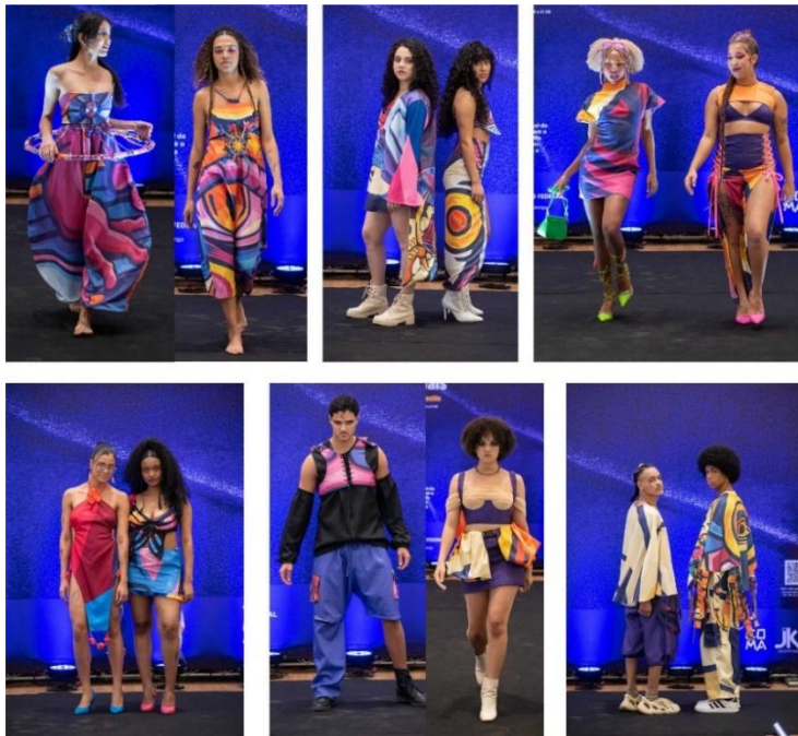
Figura 8: Imagens do desfile Moda e Festivais

O ápice da articulação com a extensão universitária ocorreu na fase de divulgação e na posterior projeção pública do trabalho. Esta etapa focou no registro e na comunicação profissional dos projetos, culminando na produção de editoriais fotográficos, fashion films e portfólios completos. A rigorosa documentação de todas as fases, desde a pesquisa inicial até os moodboards de cabelo e maquiagem, assegurou que o trabalho tivesse valor técnico e comunicacional. Os resultados alcançados transcenderam a sala de aula, gerando um concurso, um desfile e uma exposição em parceria com o JK Shopping em agosto de 2025, além de outra exposição no evento ConectaIF, em outubro do mesmo ano.