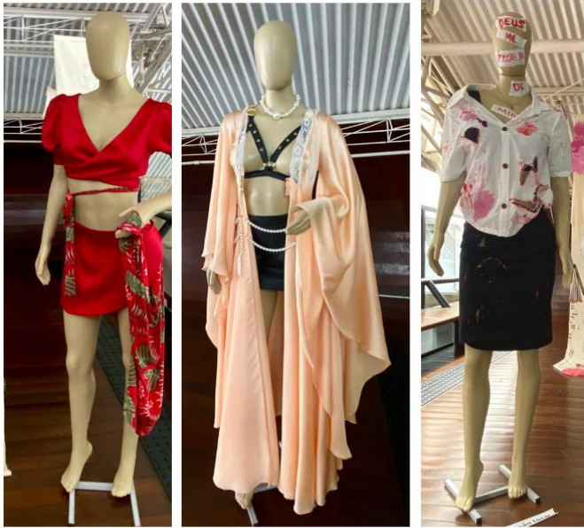
Figura 1: As personagens Rita Baiana, Estela e Piedade