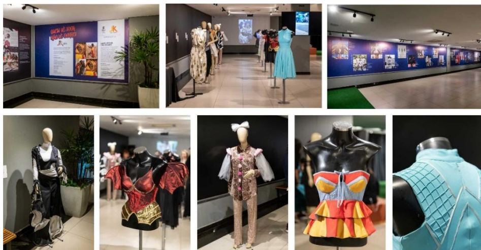
Figura 7: Imagens da exposição Quem Vê Look, Não Vê Corre! , no JK Shopping

as mais recentes, incluindo criações de sala de aula, figurinos, peças para uso pessoal, e Trabalhos de Conclusão de Curso.