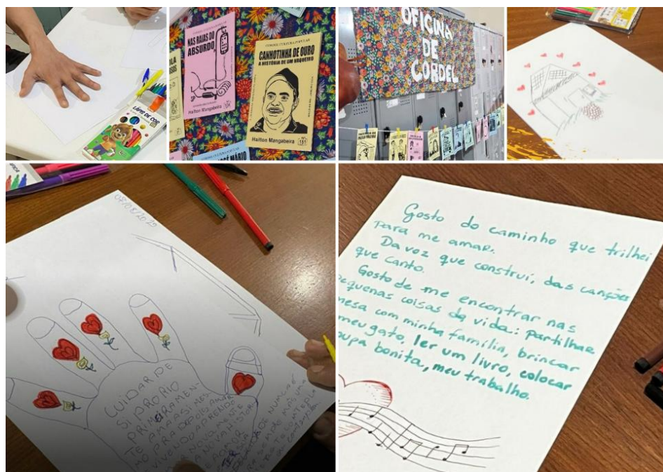
Figura 3: Materializações de oficinas do projeto “Da Rua Para’Nóia”