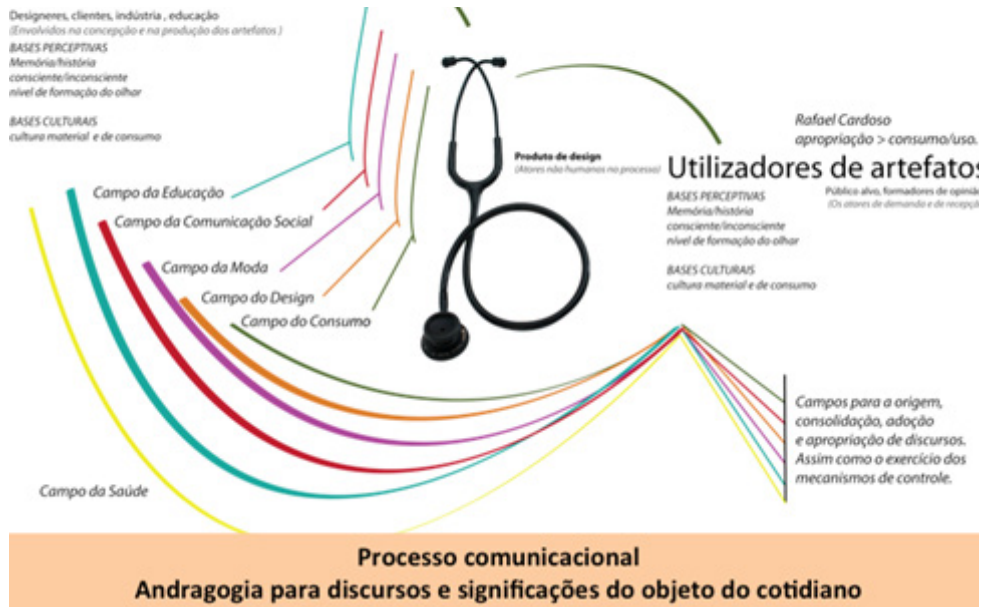
Figura 04: Análise do sistema de significação de um Estetoscópio como artefato produzido pelo campo do design e utilizado pelo campo da saúde.

Esse gráfico ajudou aos alunos na compreensão de que existem várias intencionalidades, o que a Rafael Cardoso (1998), entera como um processo de fetichização , na produção dos objetos que fazem parte do cotidiano profissional deles, e que designers e consumidores são responsáveis por isso. Não há uma aleatoriedade nessa produção, pois ela também faz parte da cultura de consumo global.