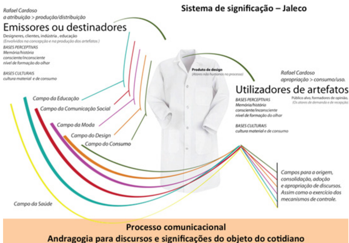
Figura 06: Análise do Sistema de Significação de um Jaleco como artefato produzido pelo campo do design e utilizado pelo campo da saúde.