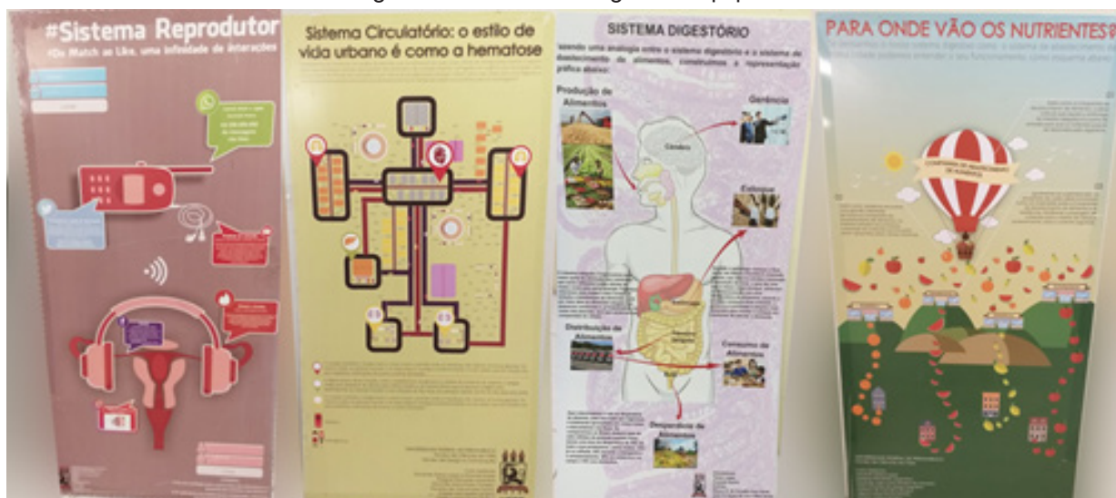
Figura 03: Posters de algumas equipes.