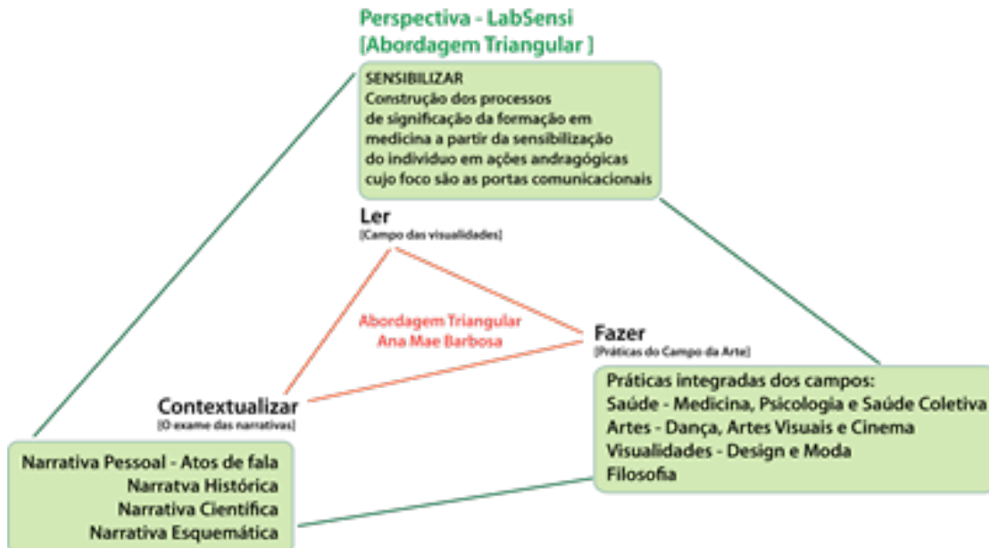
Figura 02: a abordagem triangular e o ensino da medicina com base na perspectiva do Laboratório de Sensibilidades – UFPE – CAA.