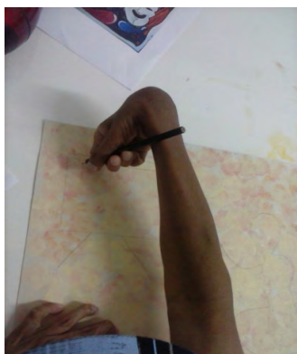
Figura 2: o uso de material adaptado