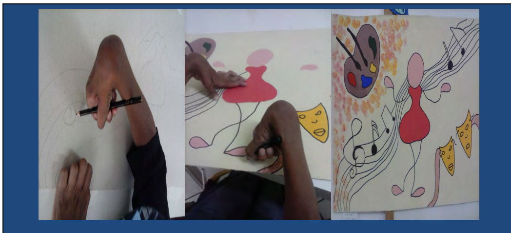
Figura 1: Elementos da arte na produção artística do aluno

papel Paraná, e colorindo com as cores que mais chamou a sua atenção nas obras de Lautrec, como se pode observar nas imagens abaixo, figura 1.