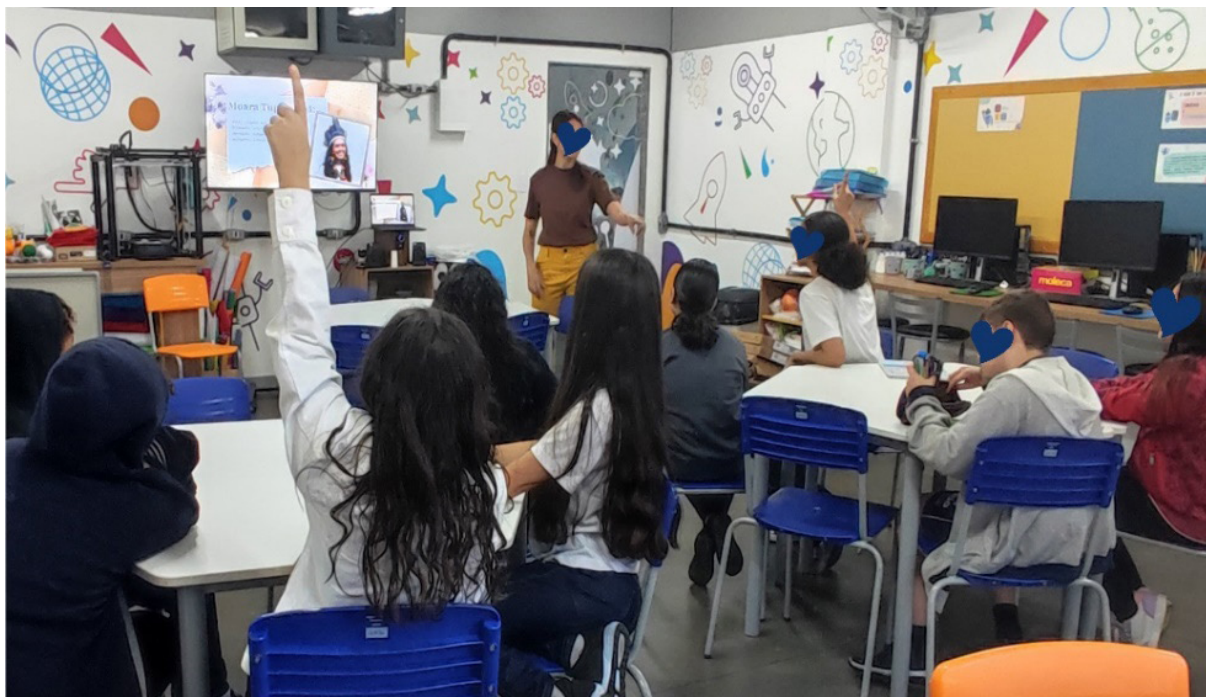
Fig. 1. A autora, Discussão sobre identidade e autorrepresentação, 2025. Fotografia digital, dimensões variáveis, Rio de Janeiro.