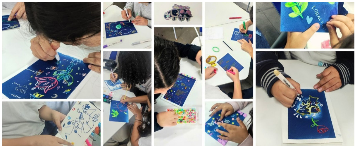
Fig. 6. A autora, Finalização e personalização das cianotipias, 2025. Fotografia digital, dimensões variáveis, Rio de Janeiro.

Em nosso último encontro, os alunos tiveram a oportunidade de finalizar suas cianotipias, dando forma às ideias que haviam amadurecido ao longo do processo. As mesas se encheram de cores, texturas e experimentações: houve quem recorresse à aquarela, quem preferisse colar miçangas, bordar, pintar com hidrocor ou construir um boneco articulado. Cada trabalho revelava um pouco de quem eram, fragmentos de suas histórias, afetos e modos singulares de ver o mundo. Em cada composição era possível perceber traços de uma identidade em construção, mas que se manifestavam de maneira genuína e poética.