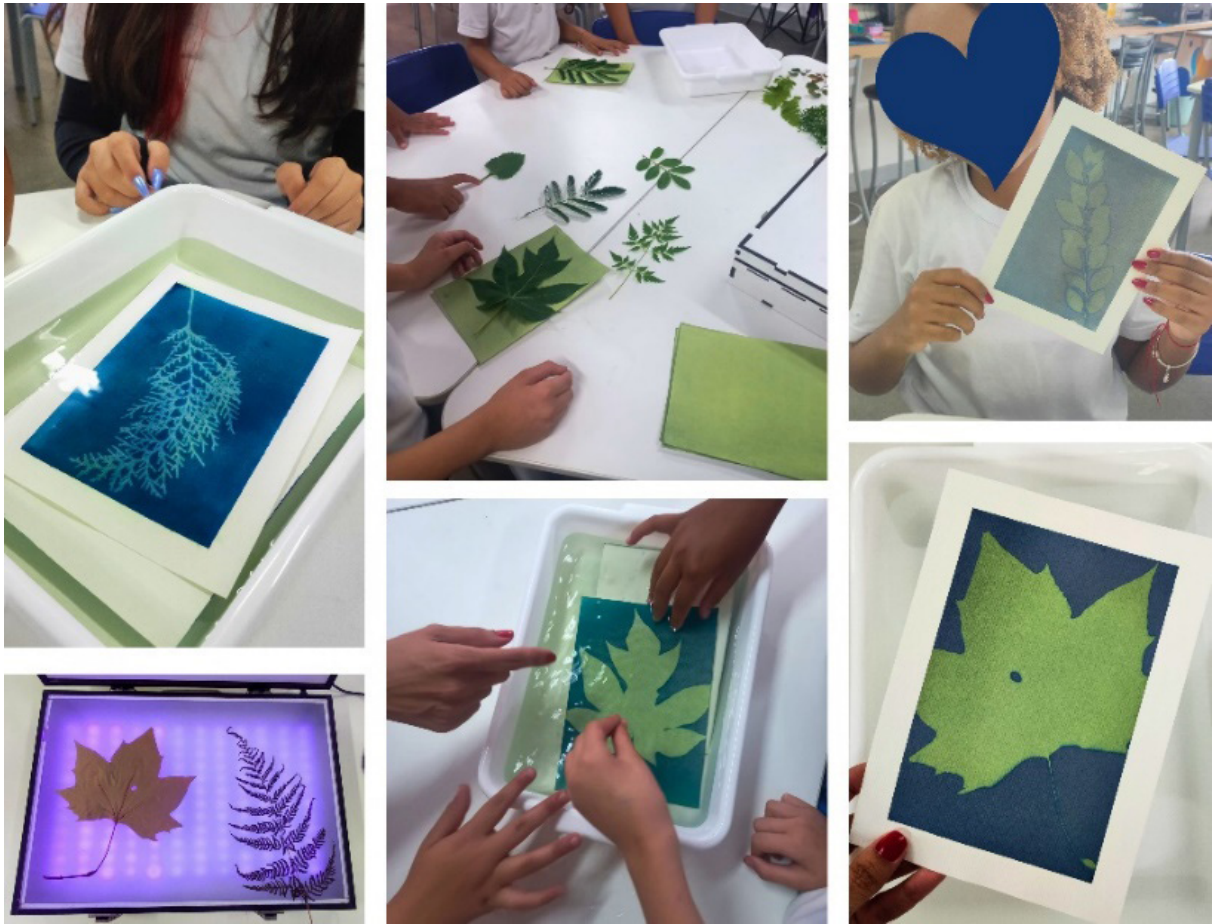
Fig. 9. A autora, Composição, exposição à luz UV e revelação das cianotipias, 2025. Fotografia digital, dimensões variáveis, Rio de Janeiro.

No quarto e quinto encontros, nos dedicamos às etapas de finalização e preparação da exposição. Com hidrocor, caneta metálica e aquarela, os alunos ampliaram as narrativas visuais de suas cianotipias, conferindo cor, brilho e detalhes às impressões botânicas. Alguns optaram por intervenções delicadas; outros criaram composições mais vibrantes, e cada trabalho parecia carregar um fragmento de quem o produziu. Paralelamente, aproveitamos esse momento para definir o espaço expositivo e organizar a montagem da nossa exposição, articulando as produções de maneira que dialogassem entre si e com o ambiente escolar.