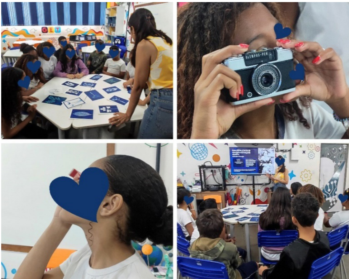
Fig. 7. A autora, Introdução à fotografia, à cianotipia e à trajetória de Anna Atkins, 2025. Fotografia digital, dimensões variáveis, Rio de Janeiro.

No primeiro encontro, propus uma contextualização histórica que funcionasse como porta de entrada para o universo da imagem. Iniciamos nossa conversa retomando aspectos da história da fotografia e explorando equipamentos analógicos, gesto que já havia mobilizado o interesse do outro grupo de estudantes durante a aplicação do Produto Educacional; o momento se tornou uma descoberta silenciosa e curiosa. Em seguida, apresentei a história da cianotipia e a trajetória de Anna Atkins, destacada como inspiração que guiou toda a oficina. Sua delicada relação com a botânica foi apresentada como ponto de partida para o trabalho que desenvolveríamos, reforçando a importância de revisitar histórias que unem arte, ciência e memória.