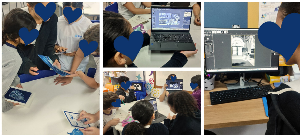
Fig. 3. A autora, Apreciação de cianotipias e criação de negativos digitais, 2025. Fotografia digital, dimensões variáveis, Rio de Janeiro.

Como desenvolvo meu trabalho em um espaço maker, o Colaboratório, aproveitei a oportunidade para introduzir uma nova etapa da experiência. Propus aos alunos a criação de um negativo digital, utilizando um aplicativo de edição de imagens (GIMP), e expliquei como essa ferramenta poderia ampliar as possibilidades de experimentação com a cianotipia.