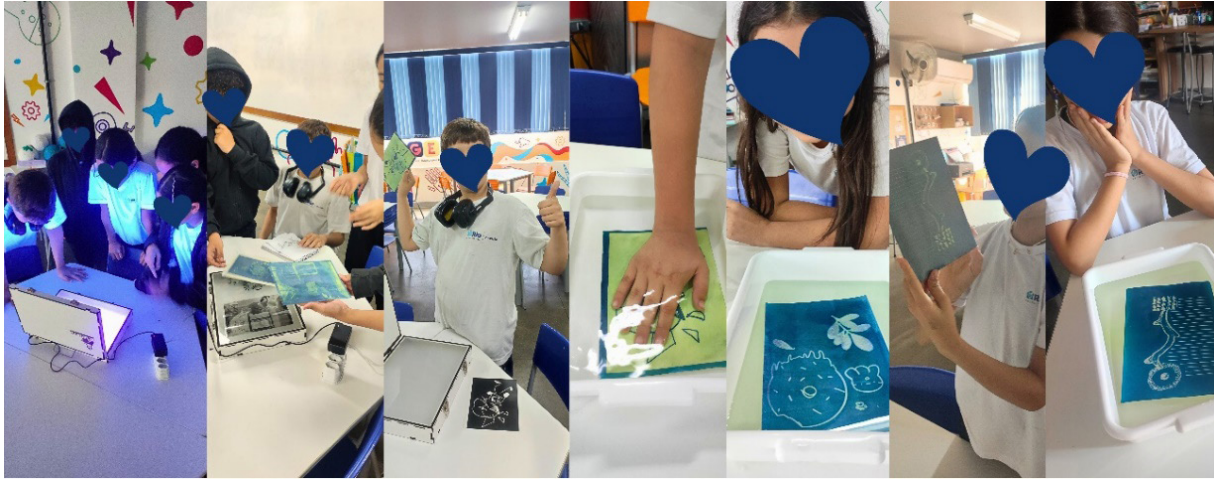
Fig. 5. A autora, Exposição à luz ultravioleta e revelação das cianotipias, 2025. Fotografia digital, dimensões variáveis, Rio de Janeiro.