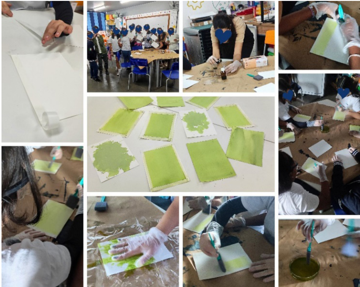
Fig. 8. A autora, Preparação dos químicos e sensibilização dos papéis, 2025. Fotografia digital, dimensões variáveis, Rio de Janeiro.

O segundo encontro marcou o início da prática. Enquanto eu preparava os químicos para a sensibilização dos papéis, os alunos organizavam as plantas coletadas no entorno da escola, observando formas, texturas e coloração. Os ensinei a emulsionar o papel, experimentando movimentos distintos: a pincelada convencional, o uso de fita adesiva para marcar margens regulares e até a técnica de splash, que permitiu explorar resultados mais espontâneos. Cada gesto carregava uma intenção, e cada superfície revelava possibilidades que só se tornariam visíveis mais tarde, sob a ação da luz.