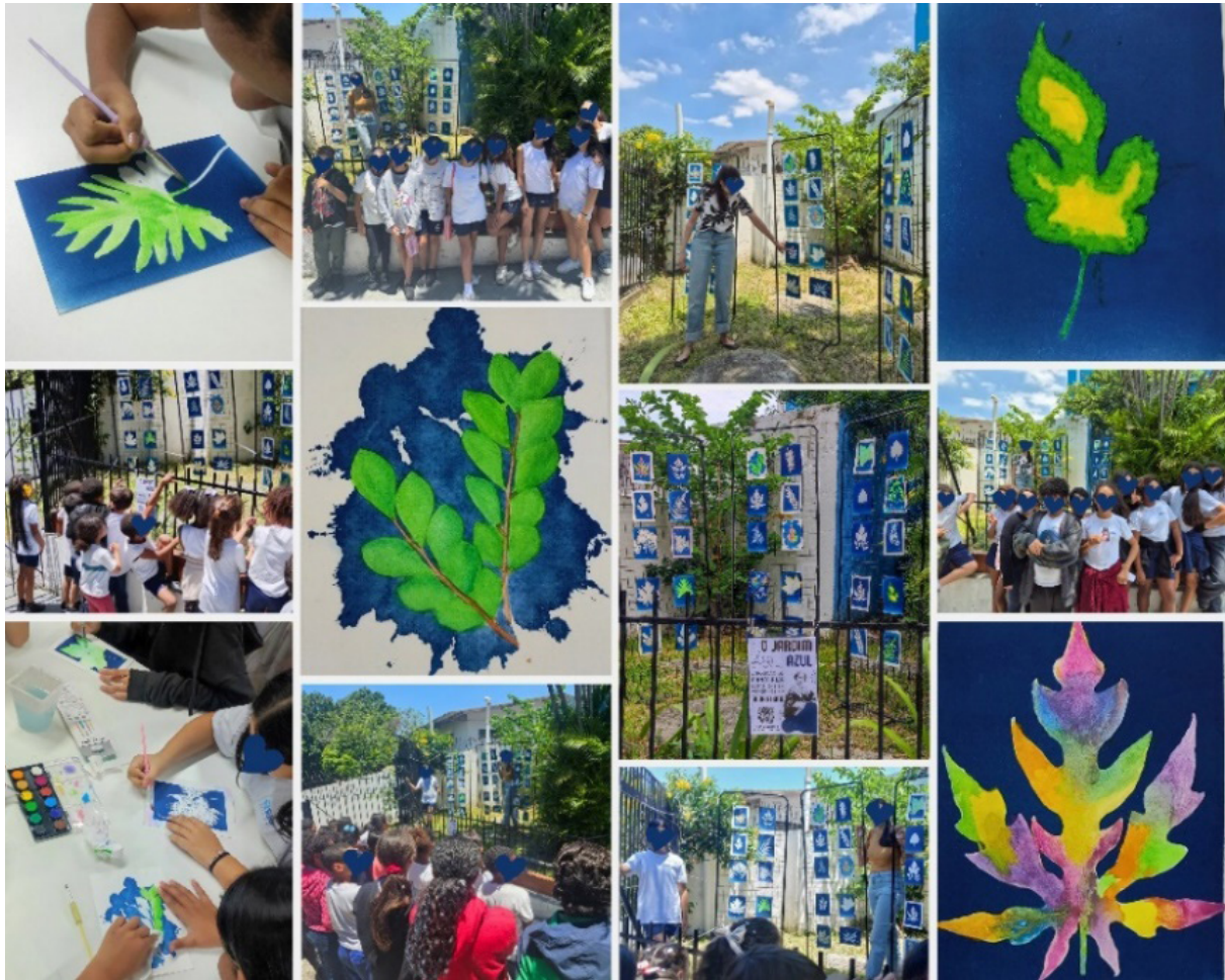
Fig. 10. A autora, Intervenções artísticas nas cianotipias e montagem da exposição, 2025. Fotografia digital, dimensões variáveis, Rio de Janeiro.

A exposição final, intitulada “O Jardim Azul: uma exposição de cianotipia botânica em homenagem a Anna Atkins”, foi instalada no jardim da escola, onde permaneceu aberta à visita ao longo de uma semana. O espaço, preenchido por azuis intensos, transformou-se em um convite à fruição estética e ao diálogo. Alunos de outras turmas, professores, famílias e funcionários se aproximaram das obras com curiosidade e sensibilidade, e as crianças participantes da oficina assumiram espontaneamente o papel de mediadoras, explicando quem foi Anna Atkins e sua relevância para a fotografia e a botânica, descrevendo o processo da cianotipia, compartilhando curiosidades e relatando suas próprias experiências.