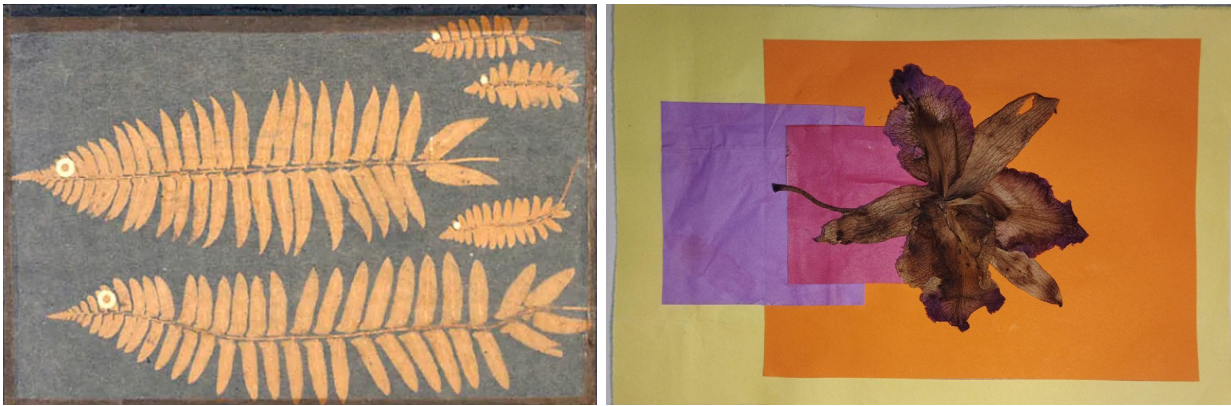
Fig. 7. Josef Albers, Leaf Study VIII, ca. 1940. Folhas de samambaia secas e anéis sob papel vegetal, montadas sobre quadro preto. Dimensões não especificadas. Coleção Josef and Anni Albers Foundation. Nova York.