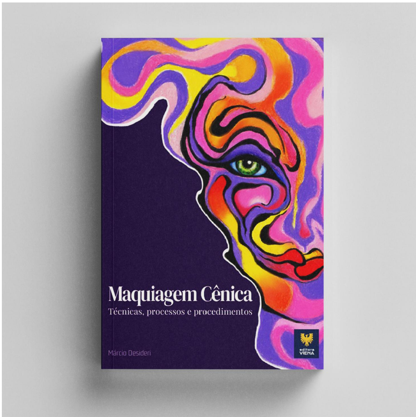
Imagem 01 - Capa do livro Maquiagem Cênica - Marcio Desideri