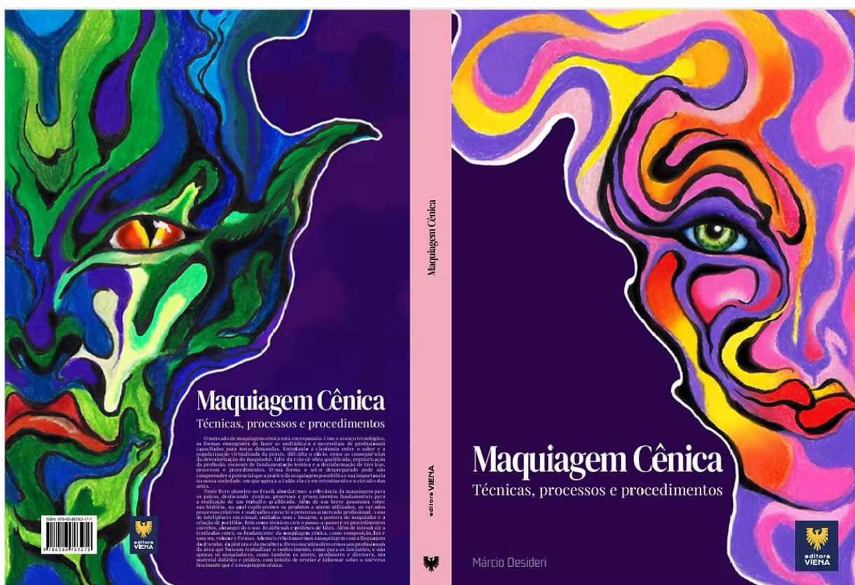
Imagem 02 - Capa e Contracapa do livro Maquiagem Cênica - Márcio Desideri