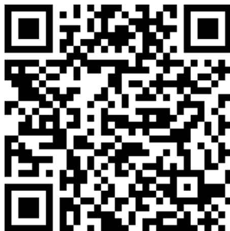
Peles Cênicas Fotolivro Vol. I