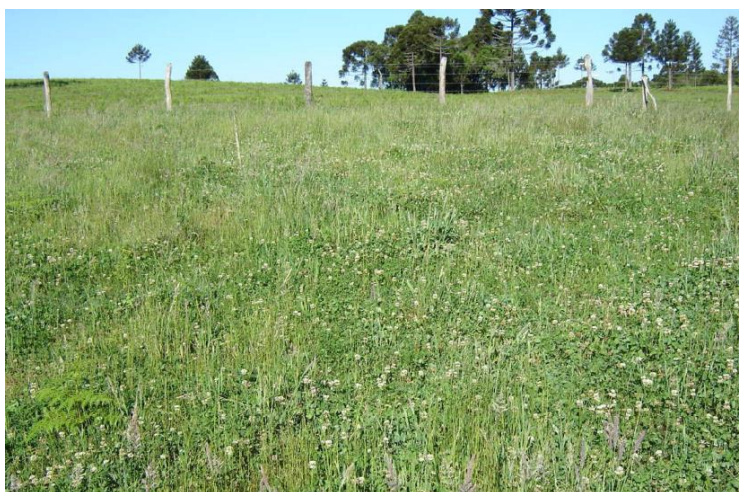
Figura 3 – Condição da pastagem no momento da entrada dos animais.

da matéria orgânica (DIVMO), os nutrientes digestíveis totais (NDT) e o teor de proteína bruta (PB) foram determinados pelo Laboratório de Nutrição Animal (LNA) da EEL.