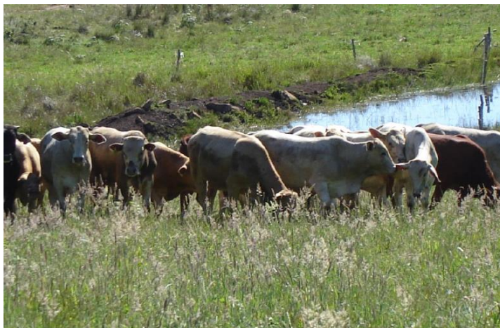
Figura 1 – Momento da entrada dos novilhos em um dos piquetes.