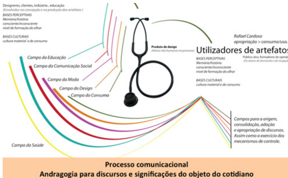
Figura 04: Análise do sistema de significação de um Estetoscópio como artefato produzido pelo campo do design e utilizado pelo campo da saúde.