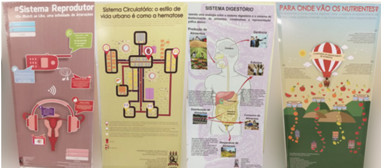
Figura 03: Posters de algumas equipes.