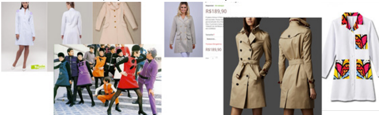
Figura 07: Diversos estetoscópios com seus discursos visuais que atendem diversas dinâmicas como a inspiração em Pierre Cardin, Burberry e Romero Brito.