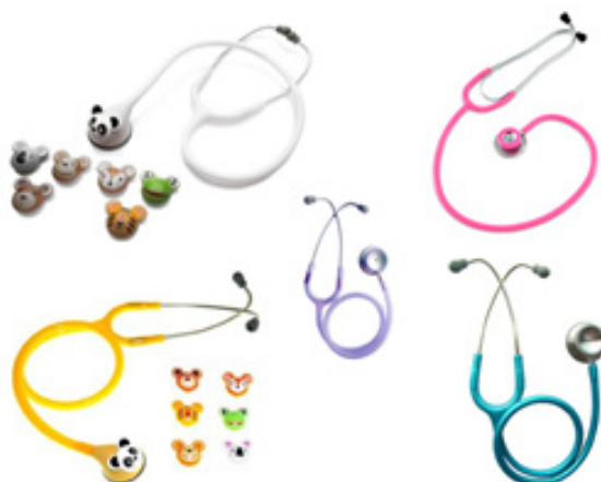
Figura 05: Diversos estetoscópios com seus discursos visuais que atendem, cada uma, a uma demanda que os alunos puderam analisar segundo as suas vivências.