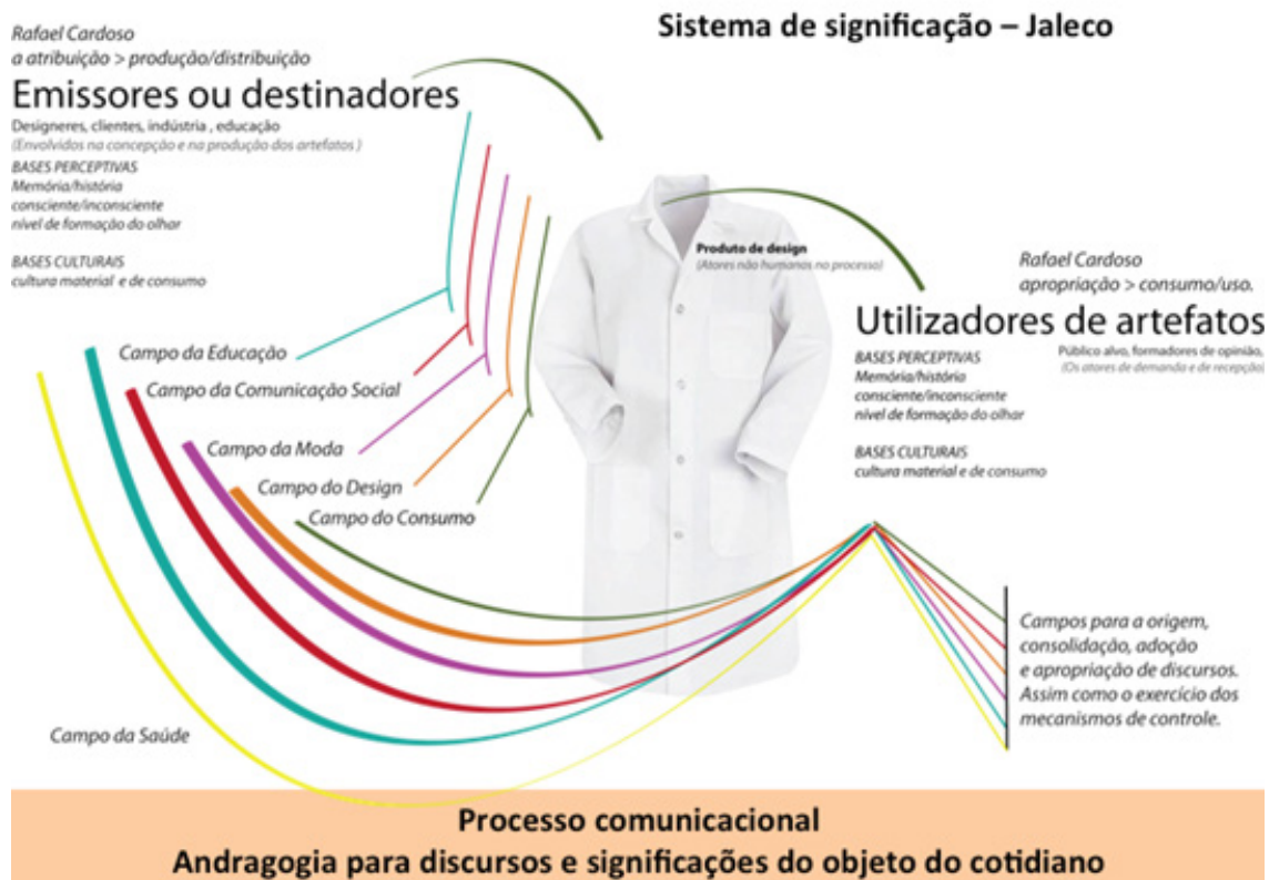
Figura 06: Análise do Sistema de Significação de um Jaleco como artefato produzido pelo campo do design e utilizado pelo campo da saúde.

saúde a se aproximar, por exemplo, de públicos como as crianças, que quando veem ao encontro de um profissional de saúde, muitas vezes estão fragilizadas, vulneráveis e a interface lúdica gera aí uma possibilidade de uma qualidade melhor na aproximação.