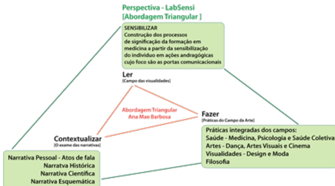
Figura 02: A abordagem triangular e o ensino da medicina com base na perspectiva do Laboratório de Sensibilidades – UFPE – CAA.